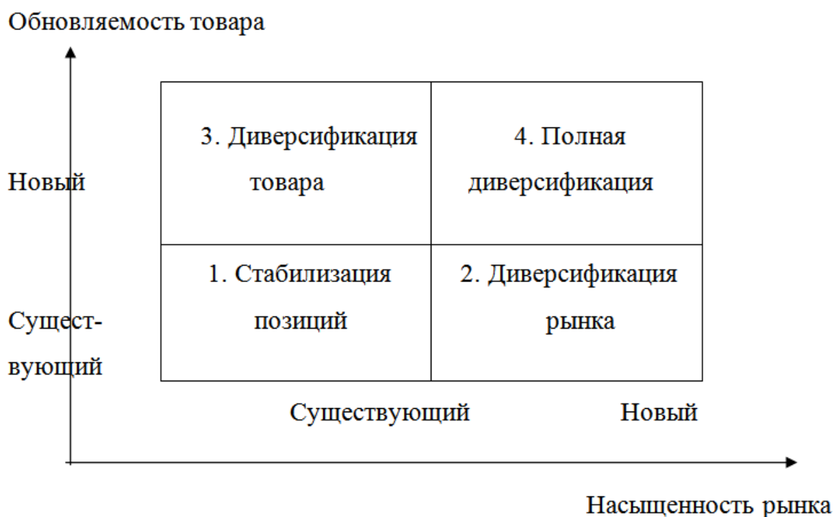
Рис. 1 - Матрица маркетинговых стратегий Ансоффа.

Выбор стратегии товара филиала на рынке отражен на рис. 1.